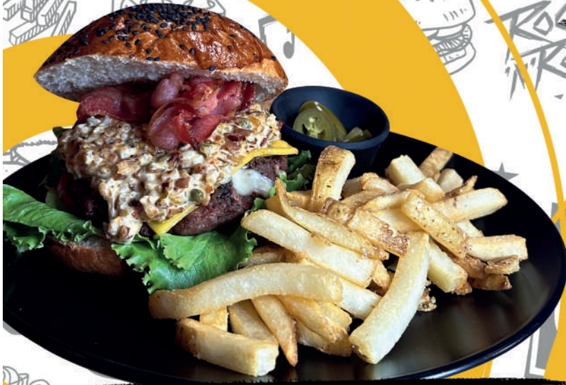
PUNK CHEESE BURGER (180G) $294