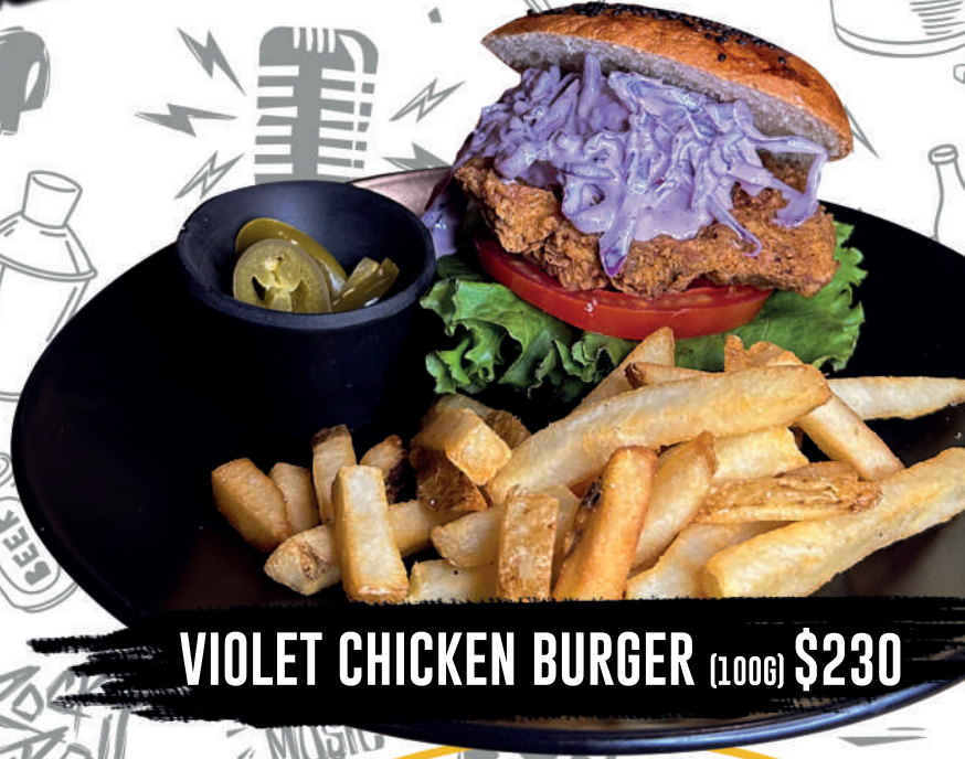
VIOLET CHICKEN BURGER (100G) $230